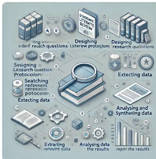
Gambar 1. Metode SLR

Penelitian ini mengadopsi pendekatan systematic literature review (SLR) untuk menganalisis dan mensintesis literatur ilmiah terkait peran platform digital dalam pertumbuhan technopreneurship. Metodologi SLR dipilih karena kemampuannya dalam mengintegrasikan dan menganalisis secara sistematis berbagai temuan penelitian, mengidentifikasi kesenjangan pengetahuan, dan menghasilkan perspektif komprehensif tentang topik yang diteliti. Proses penelitian dilakukan melalui beberapa tahapan sistematis yang mengikuti protokol PRISMA (Preferred Reporting Items for Systematic Reviews and Meta-Analyses). Tahap pertama melibatkan pencarian sistematis pada database akademik terkemuka, termasuk Scopus, Web of Science, IEEE Xplore, dan Google Scholar. Pencarian dilakukan menggunakan kombinasi kata kunci yang telah ditentukan, meliputi: " digital platform, technopreneur, digital entrepreneurship, technology entrepreneurship, digital transformation, dan entrepreneurial success factors ".